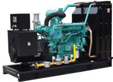
机组外形, 仅供参考