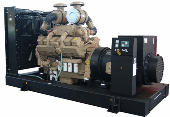
机组外形, 仅供参考