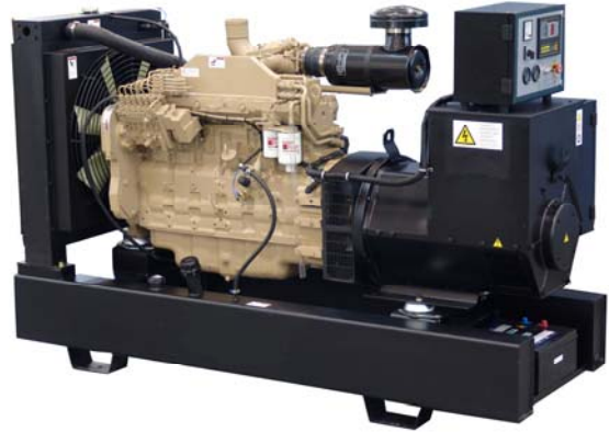
机组外形, 仅供参考