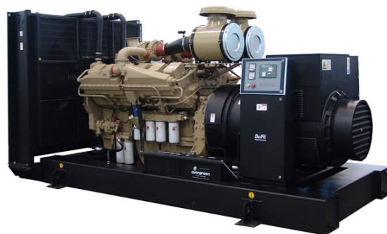
机组外形, 仅供参考